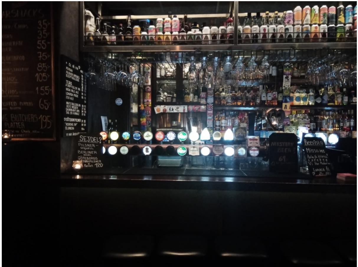
魚ステーキとビール。