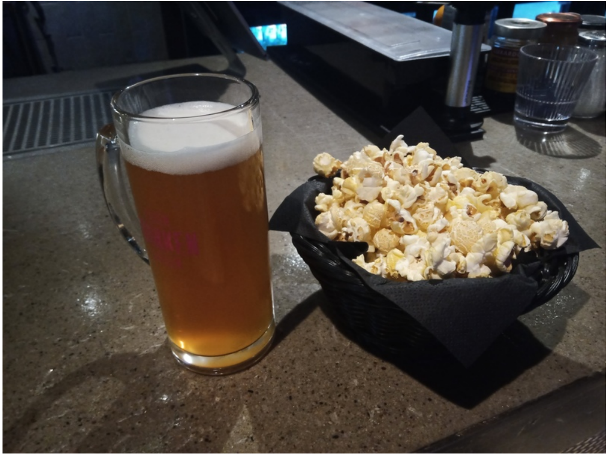
ビールのラインナップ.